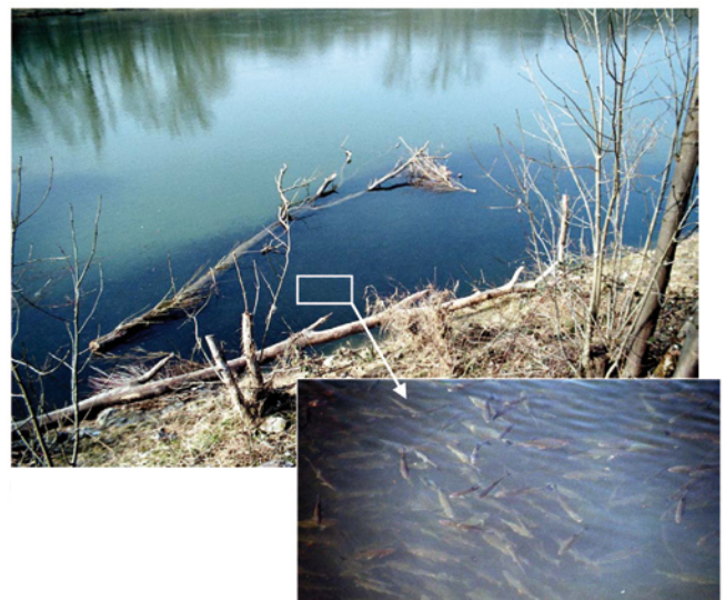
Fische suchen Unterstände: Fischeschwarm an einer Buhne im Restrhein

Totholz hat jedoch noch weitere positive Effekte auf Fischbestände: Der sich rasch bildende Überzug aus Algen und Kleintieren gibt Fischen zusätzliche Nahrung, was besonders in sonst nahrungsarmen Gewässern wichtig ist. Ausserdem sorgt das Totholz für verschiedenen schnelle Fließgeschwindigkeiten im Gewässer. Gerade Jungfische brauchen strömungsberuhigte Bereiche, in denen sie insbesondere bei höheren Wasserständen nicht abgetrieben werden. Durch die unterschiedliche Strömungsgeschwindigkeit werden ausserdem Kieslaichplätze gefördert.